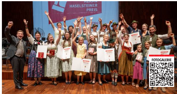
Herma-Haselsteiner-Preis: Die Musikerinnen und Musiker feiern gemeinsam ihre Auszeichnungen.