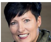
Organisation: Steffi Holaus